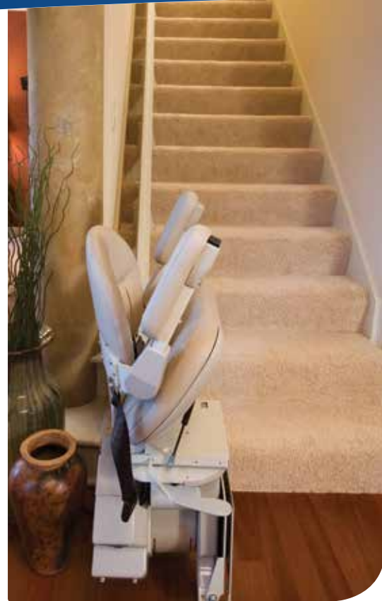
Instalación cercana a la pared.