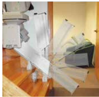
Riel con repliegue eléctrico o manual para abrir paso en pasillos estrechos o puertas que están en la parte inferior de las escaleras. Operación manual o automática con botones.