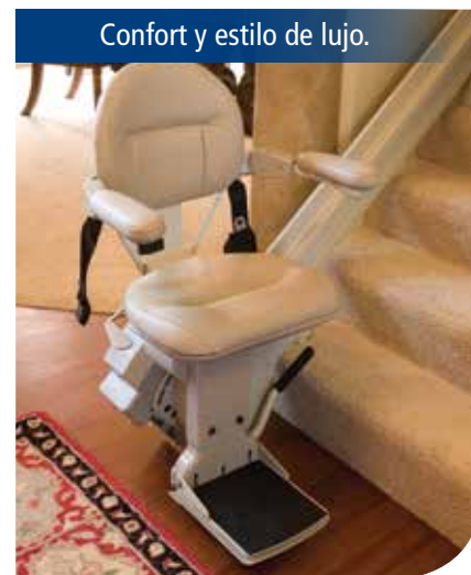
Confort y estilo de lujo.