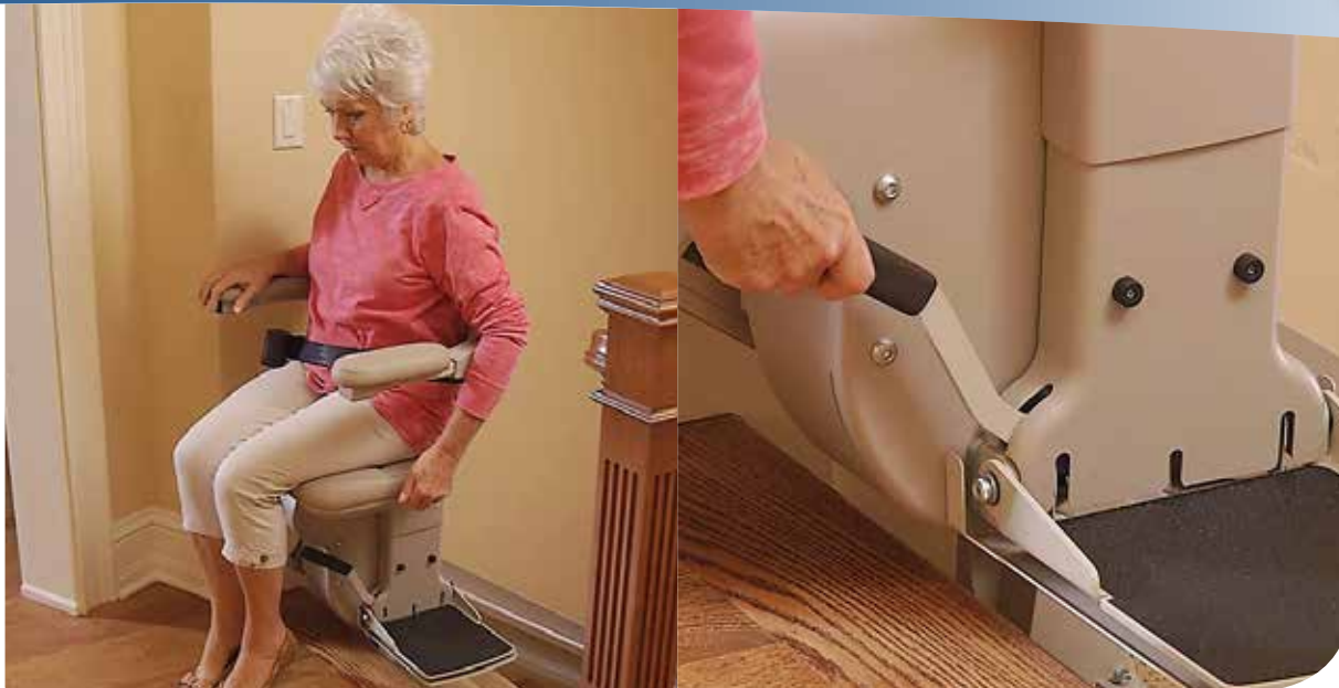
Asiento giratorio que sale para que usted se siente y se pare fácilmente