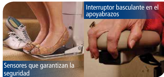
Interruptor basculante en el apoyabrazos