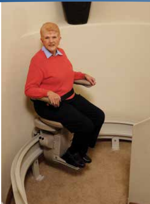
Fabriqué sur mesure pour se mouler aux courbes avec précision.