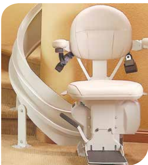
Confort et esthétique luxueux.

Vinyle brun clair standard, plus cinq choix de recouvrement facultatifs. Possibilité de rembourrage sur commande avec votre propre tissu.